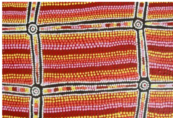
Oeuvre de Lynette Napanangka Sampson Busch Onion Dreaming, 2009

Ouverture et Première collection de la Galerie Kungka !