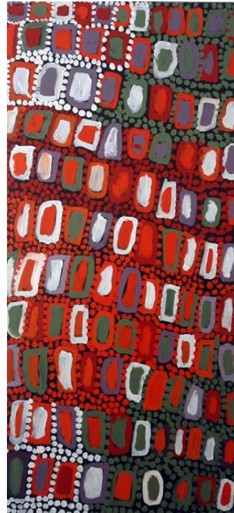
Oeuvre de Rosie Spencer Acrylique sur toile 150X76

N'hésitez pas à prendre rendez-vous avec Eva Passelègue (voir coordonnées plus bas) pour une présentation en avant première.